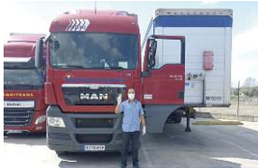
Collado, de Mesquitrán, empresa con sede en Teruel, ayer en un área de servicio

Las empresas dedicadas al transporte de mercancías por carretera en la provincia destacan ayer su “carácter estratégico” para mantener abastecidos a comercios de primera necesidad, industrias agroalimentarias y servicios sanitarios, entre otros.