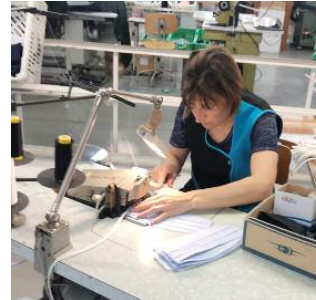
Ultrando los pliegues de las mascarillas