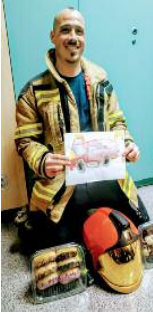
Un agente, con los regalos recibidos

En referencia a esa jornada, en la misiva puede leerse: "Queridos héroes: Nos gustaría de alguna forma agradeceros el chute de alegría y energía que nuestro acto nos dio [...]. Ver que de re-