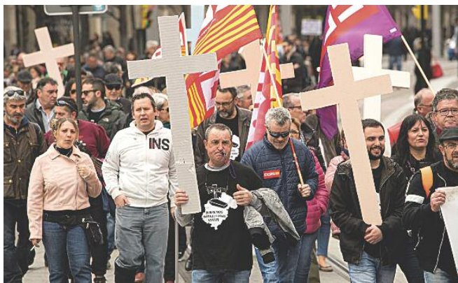
EL 'ENTIERRO' DE LA TRANSICIÓN JUSTA. Trabajadores y afectados por el cierre de la térmica de Andorra durante la manifestación en Zaragoza.

Centenares de manifestantes exigen al Gobierno planes de futuro y empleo Lambán afirma que el Ejecutivo ya trabaja en el futuro de las cuencas mineras