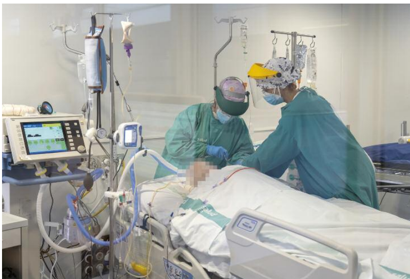
LA REALIDAD DEL COVID. Dos sanitarias atienden, ayer por la tarde, a uno de los pacientes que está ingresado en la UCI del Hospital Obispo Polanco de la capital. Antonio García

Fundado en 1936 Nº 25.475 Precio: 1,30 € www.diariodeteruel.es Jueves, 22 de octubre de 2020