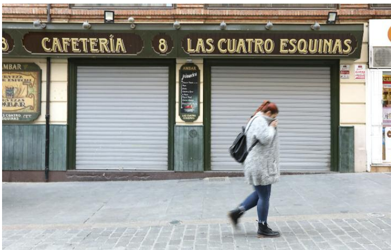
Una mujer pasa, ayer por la tarde, frente a un bar cerrado en la calle de San Juan de Teruel. Javier Escarich