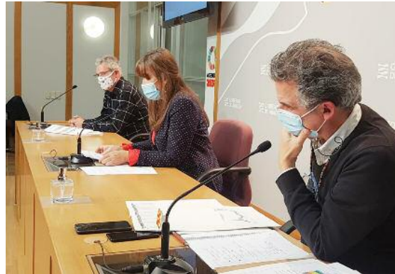
MÁS MEDIDAS EXTRAORDINARIAS. La consejera de Sanidad, Sira Repollés, junto a los directores generales de Salud Pública y Asistencia Sanitaria, en la rueda de prensa en la que se anunciaron medidas extraordinarias contra la pandemia

la situación de crisis. Entre otras medidas se podrá optar por la movilidad del personal para atender las necesidades que puedan surgir. En la Comunidad pasa a existir un mando único sanitario en todo el territorio y los recursos materiales y humanos de los centros y establecimientos sanitarios privados se ponen a disposición del Servicio Aragonés de Salud.