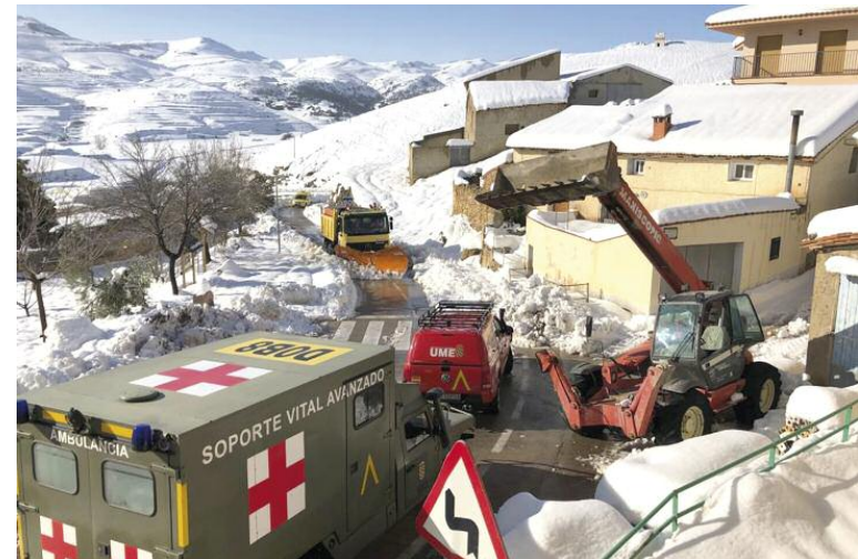
TODOS A UNA. Un vecino con una máquina, una quitanieves y los militares de la UME, ayer realizando labores de limpieza en Ejlive. Alejandro Banyal