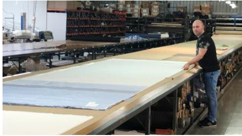
Un trabajador prepara la tela, antes de pasar a su fabricación industrializada

La empresa Confección textil Rams de Mazaléon cerró sus puertas el viernes de la semana pasada de forma temporal al quedarse sin suministros y pedidos como consecuencia de la crisis del Covid-19. Pero sus últimos días de trabajo este mes de marzo fueron intensos en emoción e ilusión, ante el reto que las propias trabajadoras plantearon a la empresa: fabricar mascarillas ante la escasez que había en el mercado. Durante varios días se dedicaron en cuerpo y alma en este taller de la comarca del Matarraña a fabricar las mascarillas más finas que hay ahora en el mercado, hechas con telas de algodón del Nilo.