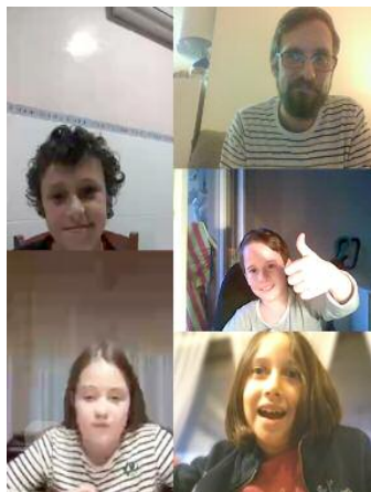
Clase en grupo en la escuela de música Gaspar Sanz de Calanda

Las clases ahora son más dinámicas y divertidas que antes, porque todo lo que ocurre, la manera en la que se plantea la clase, la forma de llevarla, etc. es una novedad. Se ha modificado la cantidad de materia y el formato. Se proponen actividades que se pueden realizar a largo plazo. A sus alumnos, el director calandino les ha enviado material que se puede trabajar durante toda la semana. Es un trabajo más a largo plazo. En este sentido, señaló que "la actitud también es muy positiva, porque las clases online