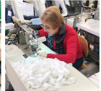
Casi toda la plantilla se implicó en la tarea