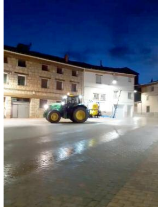
Un agricultor realiza labores de desinfección en Alfambra con su tractor

De esta manera, los agricultores colaboran con los trabajos de desinfección que ya se han iniciado, y que están llevando a cabo los distintos ayuntamientos con sus propios medios. Esta tarea se lleva a cabo en espacios comunes como consultorios médicos, establecimientos comerciales, farmacias, edificios públicos o cementerios, así como en mobiliario urbano y contenedores.