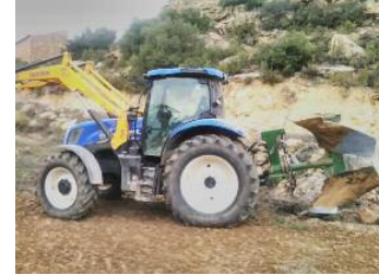
Arenas ha pospuesto el cobro del impuesto de circulación

Según Cortés, "no cobraremos en tanto no se levante el confinamiento y la gente pueda volver a trabajar". Desde su punto de vista, su iniciativa es "una pequeña ayuda, pero más vale eso que nada". Una familia media en Arens de Lledó, recordó, puede pagar "en torno a 130 o 150 euros de impuestos por este concepto, porque suele haber un vehículo