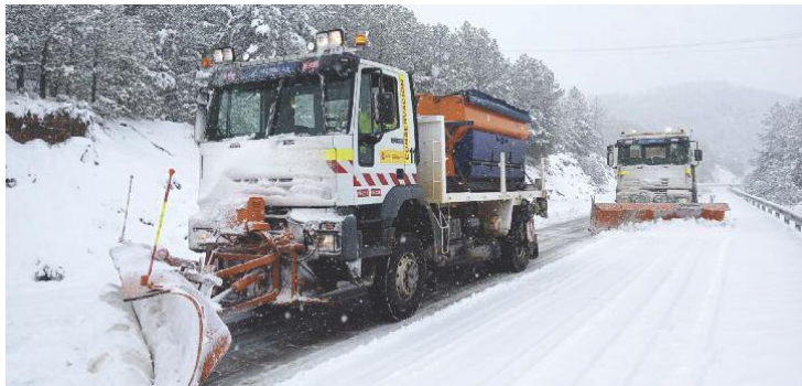
Dos máquinas quitanieves del Ministerio de Transportes limpiando ayer la carretera N-420 a la altura de El Catizor