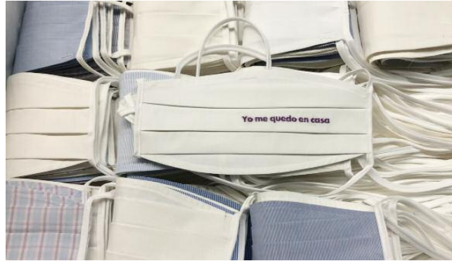
Las mascarillas fabricadas en la empresa textil de Mazaléon