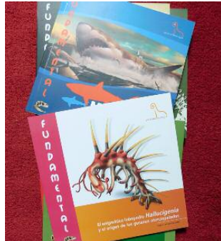
Portadas de algunos de los libros de la Fundación cuyo acceso es abierto

Al poder disfrutar de estas ediciones en pdf se puede acceder a las ilustraciones a color y gráficos que incorporan algunos de estos libros para conocer diferentes aspectos de la vida de la Tierra a lo largo del tiempo geológico. Además, las publicaciones están en formato de audios en inglés, con lo cual los estudiantes de idiomas también podrán recurrir a ellas para hacer prácticas de lectura y comprensión. Los cinco libros se corresponden con las cinco últimas publicaciones de la serie Fundamental , y todos recogen las versiones divulgativas de los tra-