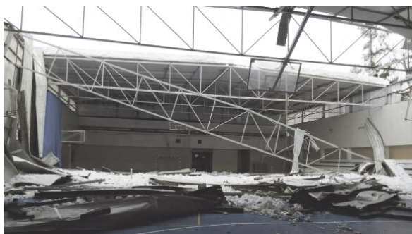
El techo de una de las zonas deportivas de Valderrobres se vino abajo por la gran cantidad de nieve acumulada