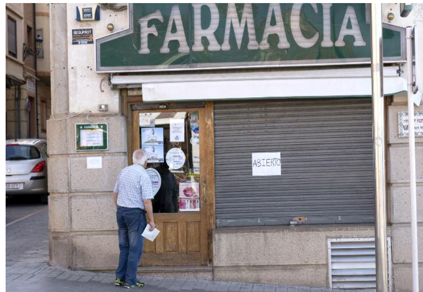
Un hombre se dispone a entrar a una farmacia de Teruel, ayer sábado.